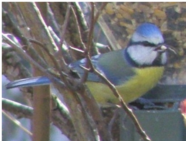
Mésange bleue photographiée à Mélagues le 17 février 2021