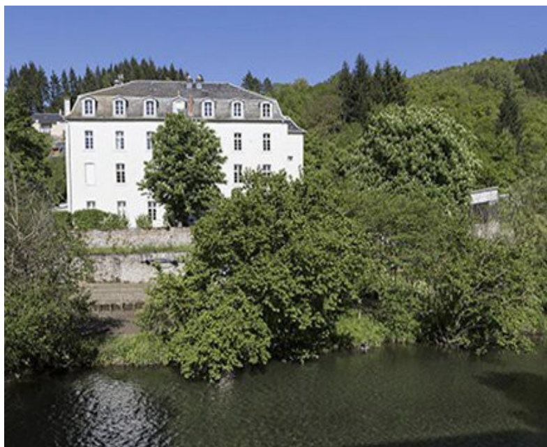
EHPAD de Brusque

A ce propos, celle-ci doit prendre sa part dans le montage du projet. Je ne suis pas certain qu'à ce jour un dialogue ait été amorcé. Il revient à la population de Brusque, celle, du moins, qui se sent concernée par le maintien de l'EHPAD, sous une forme ou sous une autre, de se mobiliser pour susciter ou appuyer les démarches de sa mairie. Pétition ? Comité de citoyens ? Création d'une association ad hoc ? N'attendez pas les prochaines élections ! En 2026, il sera trois fois trop tard !